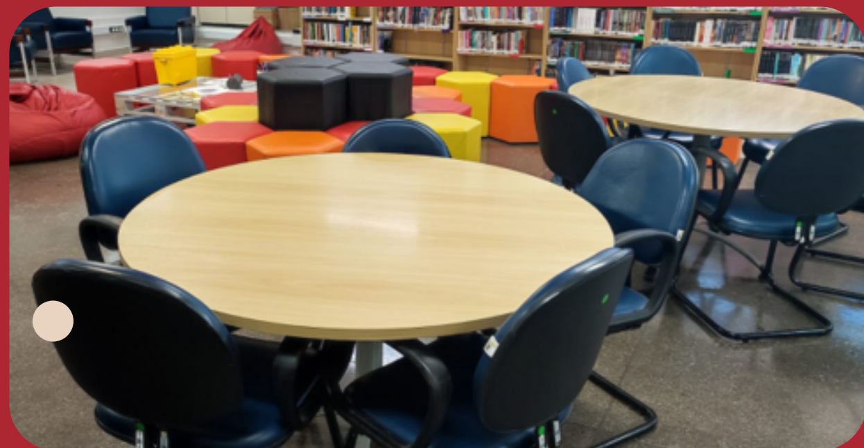
Esapços para estudos