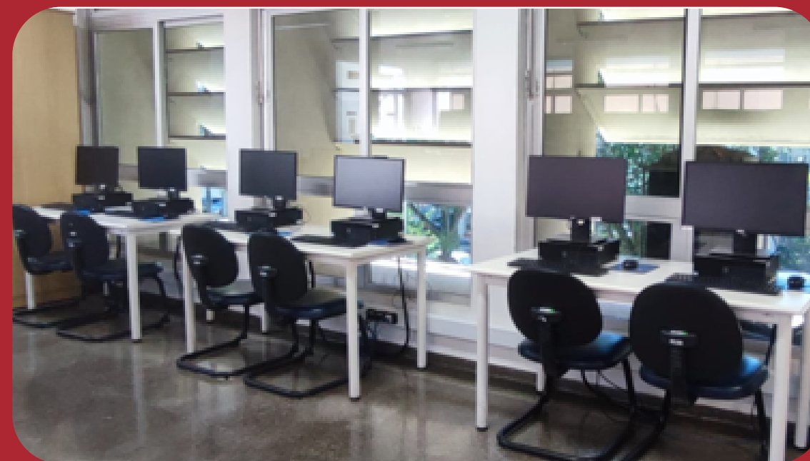
Computadores para pesquisas