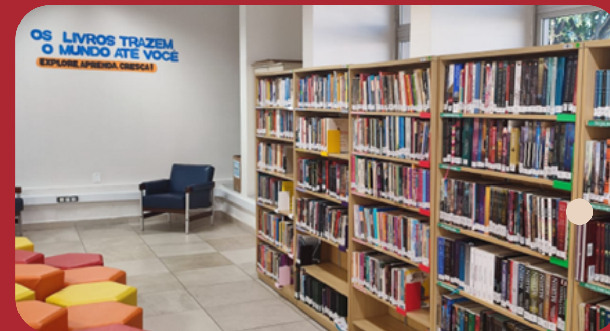
Diversos livros para leitura/pesquisa