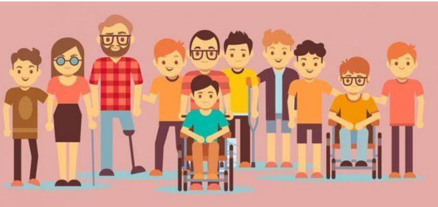
Dia Internacional da Pessoa com Deficiência

Também conhecido como o Dia Mundial das Pessoas com Deficiência, esta data tem o objetivo de informar a população sobre todos os assuntos relacionados a deficiência, seja ela física ou mental. Além disso, busca também conscientizar as pessoas sobre a importância de inserir as pessoas com deficiência em diferentes aspectos da vida social, como a política, a econômica e a cultural.