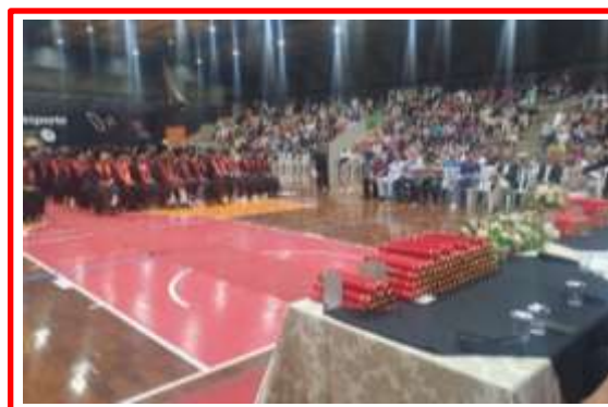
Formatura – Dezembro 2023