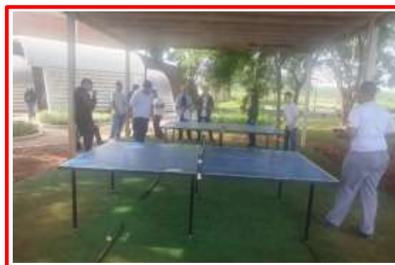
Gincana Solidária 2023