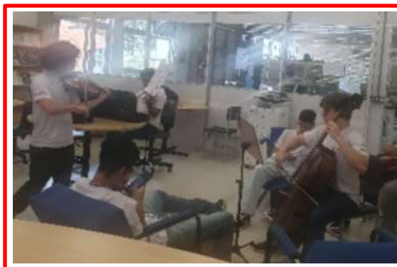
Ensaio para o Intervalo Cultural