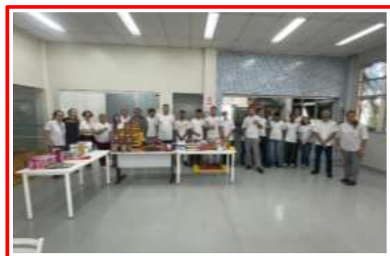
Campanha Solidária – Natal 2023