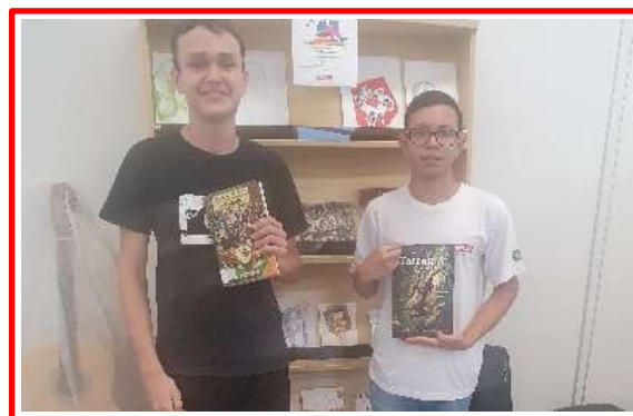
Semana do Livro e da Biblioteca