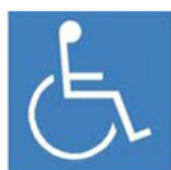
a) Branco sobre fundo azul

O Símbolo internacional de acesso deve indicar locais que possibilitem acesso, circulação e utilização por pessoas com deficiência.