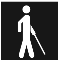
Imagem 4: Símbolo internacional de pessoas com deficiência visual

Ainda que não exista legislação específica, cabe mencionar a existência do "Símbolo Internacional de Pessoas com Deficiência Visual", ilustrado a seguir