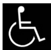
b) Branco sobre fundo preto