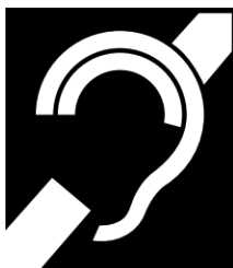
Imagem 3: Símbolo internacional de surdez / Símbolo internacional de pessoas com deficiência auditiva.

Ainda que não exista legislação específica, cabe mencionar a existência do "Símbolo Internacional de Pessoas com Deficiência Visual", ilustrado a seguir