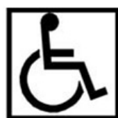
c) Preto sobre fundo branco

Imagem 1: Símbolo internacional de acesso.