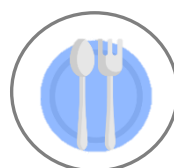
Cantina e Refeitório