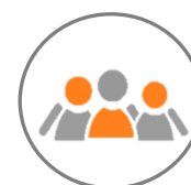
Áreas de socialização