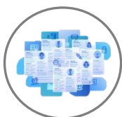
Mural de vagas