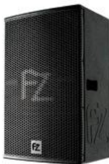
CAIXA COM SUPORTE – 2 PEÇAS