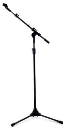
06 Pedestais RMV PSU 60