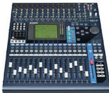
01V96VCM YAMAHA – 1 PEÇA