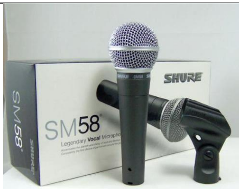
SM58LC- MICROFONE COM FIO – 2 UNIDADES