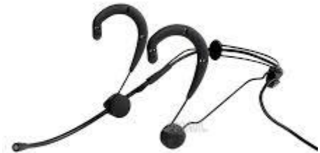
04 Microfones Shure WBH53