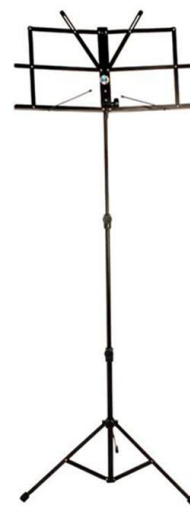
10 Estantes para partitura 6387