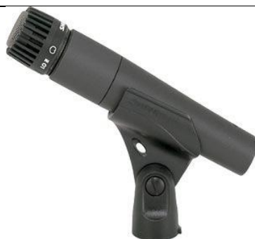
SM 57 LC – 4 PEÇAS