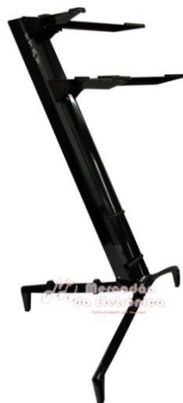
SUPORTE STAY P/ TECLADO MOD. 1300/02 - ALUM. PRETO + BAG – 1 PEÇA