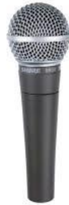
06 Microfones Shure SM58-LC