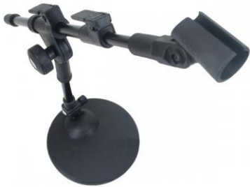
06 Pedestais de mesa PE3G