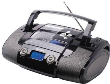
01 Radio Portátil C/CD Semp Toshiba