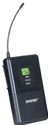
04 Transmissores Shure SLX1