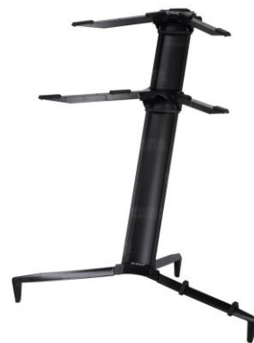
01 Suporte para teclado Stay 1100/2