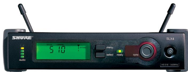
SLX4 RECEPTOR- 6 PEÇAS