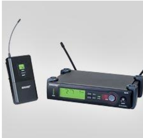
SLX1 TRANSMISSOR – 4 PEÇAS