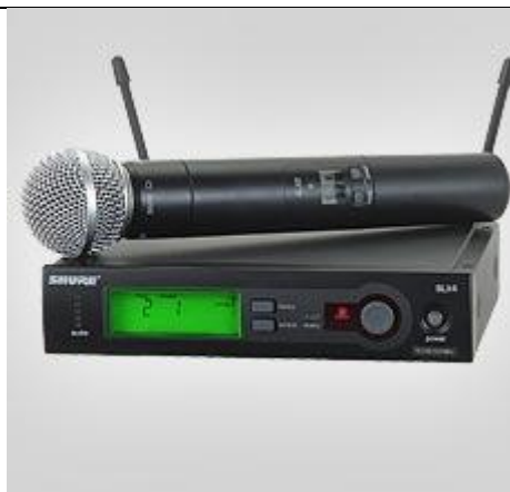
SLX2 SM58 TRANSMISSOR – 2 PEÇAS