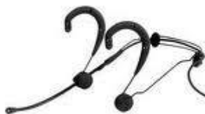
WBH53 MICROFONE – 4 PEÇAS