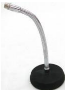
SM033 SPM – 6 PEÇAS