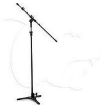
PEDESTAL PARA MICROFONE RMV PSU 60